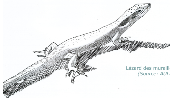
Lézard des murailles

Dans la mesure où la biodiversité et où l'environnement sont variables d'un site à un autre, il n'est pas possible de définir une stratégie unique et reproductible pour l'ensemble du territoire. En effet, le champ des leviers et le périmètre des actions sont larges et variés. La stratégie à adopter sera à définir en fonction de l'état du diagnostic initial du site. Cependant, il est possible de définir des actions et solutions générales à mettre en place, en fonction du type de corridor, pour prendre en compte les exigences de la biodiversité cible au sein d'un projet d'aménagement.