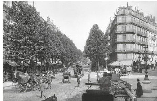
Appartement du type Haussmannien

https://www.lemoniteur.fr/article/le-paris-du-xixe-siecle-un-modele-pour-demain.736049